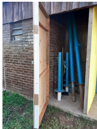
Nova Peça de material da Quadra Poliesportiva