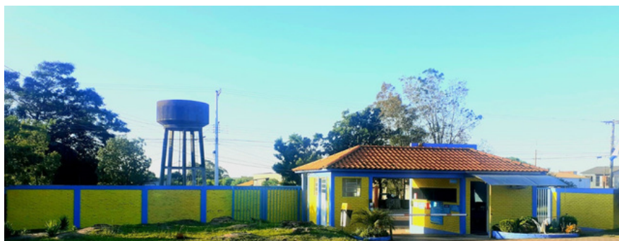
Pintura interna muro frente clube