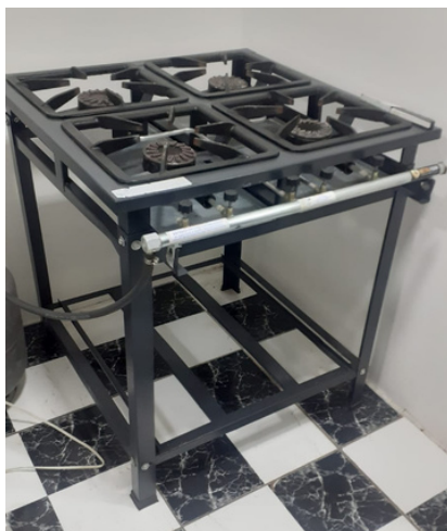
Novo fogão Bar AABB