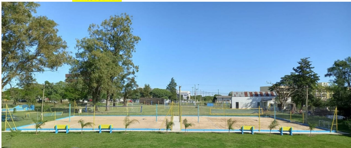
Conclusão da quadra 3 de areia que contemplará o vôlei, o futevôlei e o beach tênis. Substituição dos postes da quadra 2.