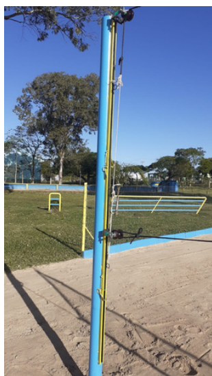
Poste com regulagem para as modalidades de Vôlei, Futevôlei e Beach Tênis