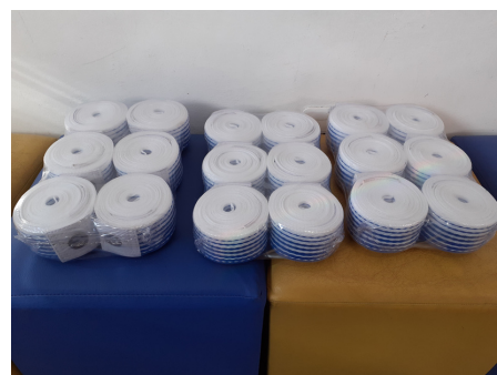
Aquisição de fitas de marcação para as 3 quadras de areia