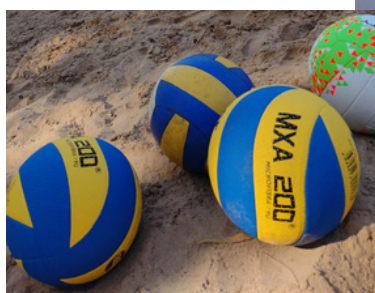
Bolas de Vôlei