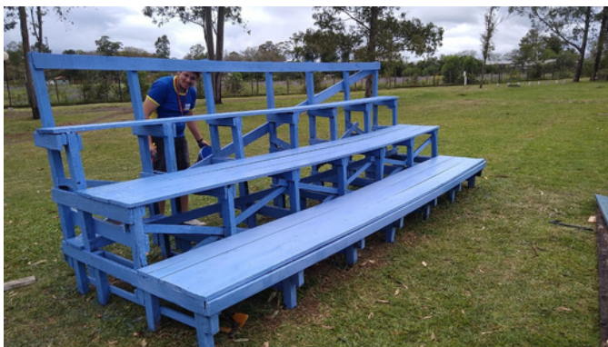
reforma e pintura arquibancada campo de futebol