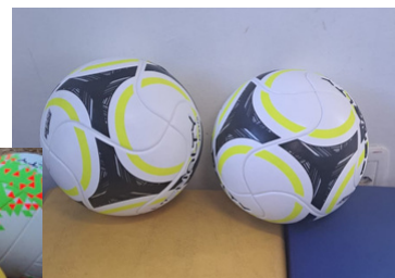
Bolas de Futebol