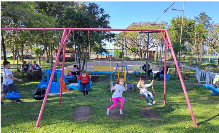
CRIANÇAS SE DIVERTIRAM MUITO NA PRACINHA