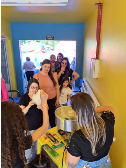
FILA DO ALGODÃO DOCE