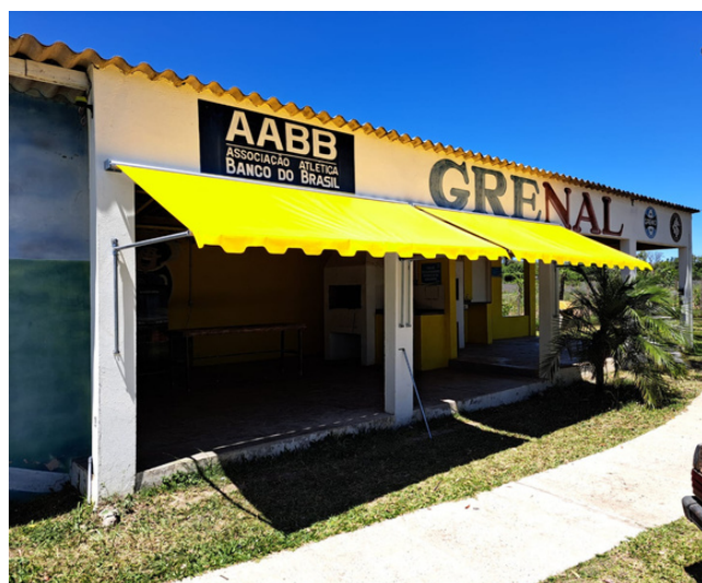
colocação de toldos no quiosque grenal