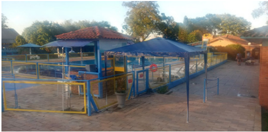
Gazebo na Entrada das Piscinas