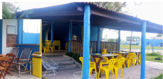
Quiosque 1º de Maio