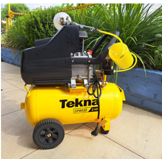
Compressor de ar para pintura