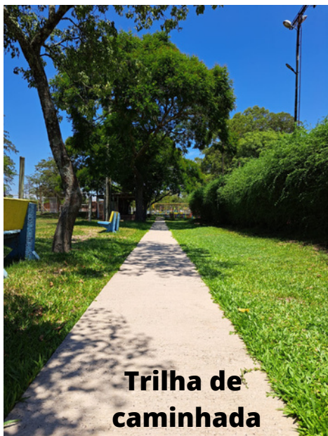
Trilha de caminhada

Queremos "apresentar" para vocês nossa trilha de caminhada. Ela possui 500m e se você caminhar nela além de ser saudável vai curtir muito. Durante o trajeto vai ouvir o canto de muitos pássaros, a algazarra das cocotas, vai passar por lagartos, preás, patos e marrequinhas no lago. Vai passar por lindas e frondosas árvores. Enfim uma trilha abençoada e de natureza encantadora. Para deixá-la mais incrível ainda, colocamos algumas placas com uma mensagem super bacana. Posso garantir que vale muito a pena fazer nem que seja uma voltinha apenas, que demora de 5 a 6 minutos. Bora lá!!!!