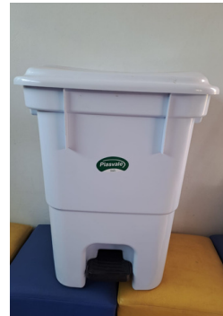
Cesto de lixo