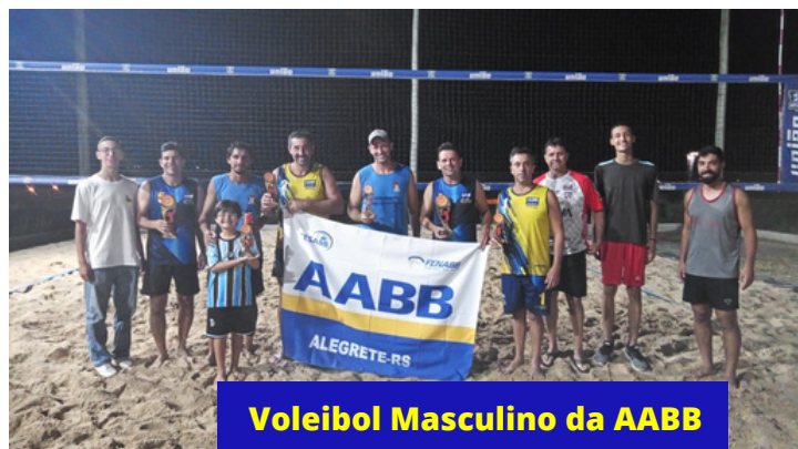
Voleibol Masculino da AABB