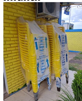
40 cadeiras novas