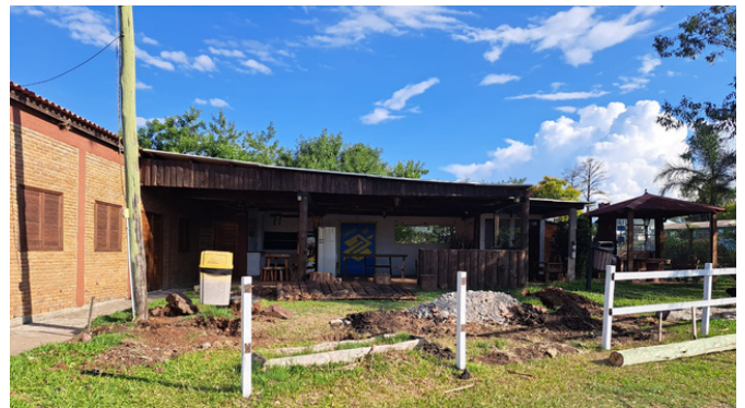
Início da obra de ampliação do "puxadinho"