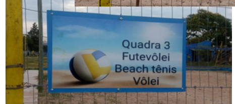
Colocação de placas indicativas nas quadras de areia