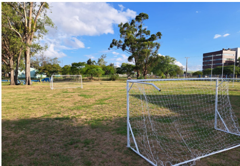
Pintura traves campo de futebol e colocação de redes novas