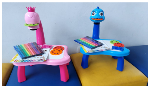
02 Mesas Projetoras Criativas de Desenho Infantil