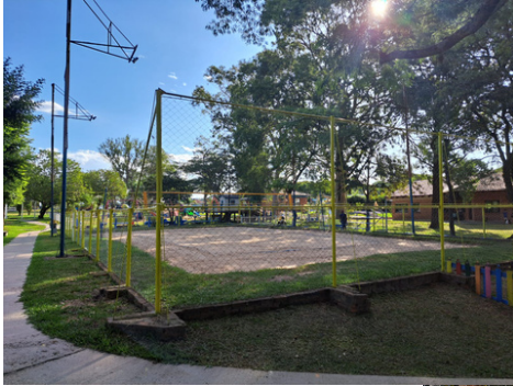
Cercamento e pintura da quadra 1