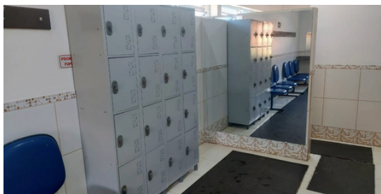
Guarda volumes vestiário feminino