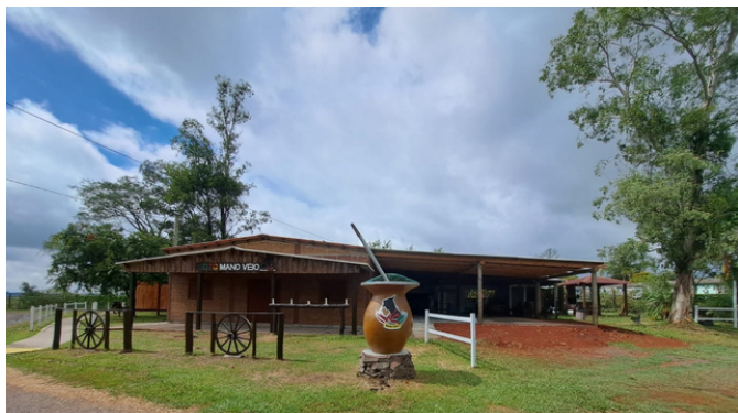
obra de ampliação do "puxadinho"