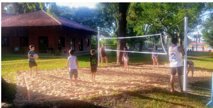
Quadra de Vôlei infantil