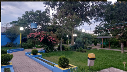
Instalação e melhorias na iluminação em diversas áreas do clube