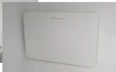
Fraldario banheiro externo área piscinas