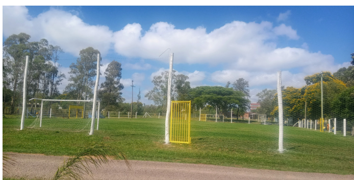
Substituição de postes, telas e pinturas no campo de futebol