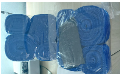
Fitas de marcação quadras de areia