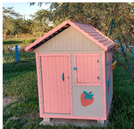
02 Casinhas para crianças