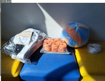
kit Vôlei para crianças