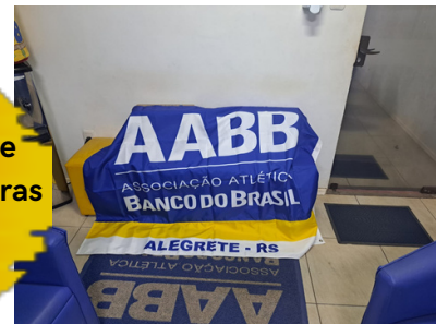
aquisição de novas bandeiras da AABB