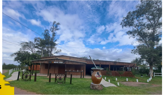
Fotos de antes e depois do Galpão Mano Vêio