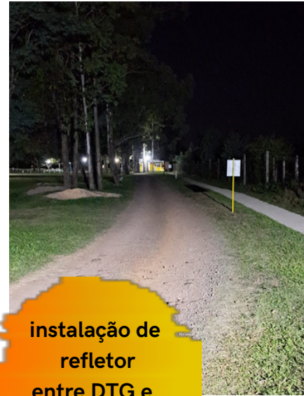
instalação de refletor entre DTG e Quiosque Grenal