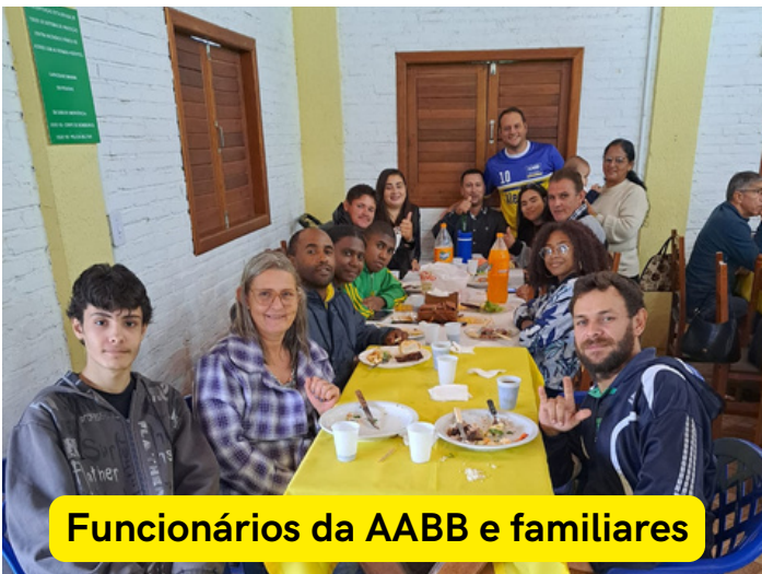
Funcionários da AABB e familiares