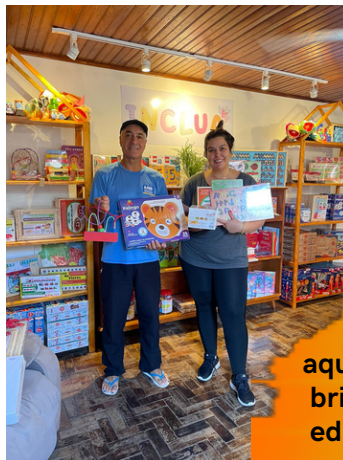
aquisição de brinquedos educativos para a brinquedoteca