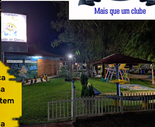
instalação de placa com iluminação na praquina que agora tem nome: Anjinho da Guarda