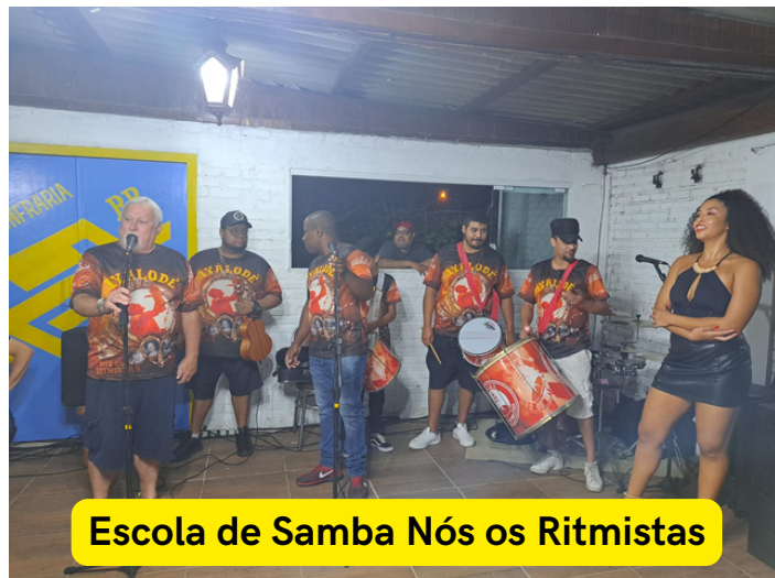
Escola de Samba Nós os Ritmistas