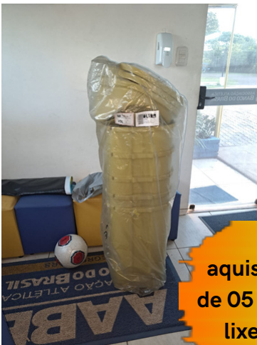
aquisição de 05 novas lixeiras