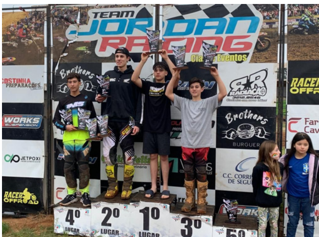
3º Lugar Categoria VX 2 em Cacequi