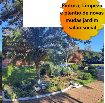
Pintura, Limpeza e plantio de novas mudas jardim salão social