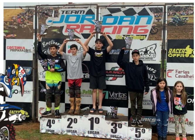
2º Lugar Categoria Junior em Cacequi