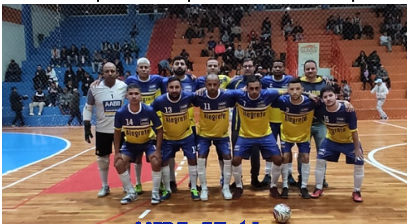
AABB 5x5 Fortaleza

Jogo muito equilibrado no Ginásio da Arena