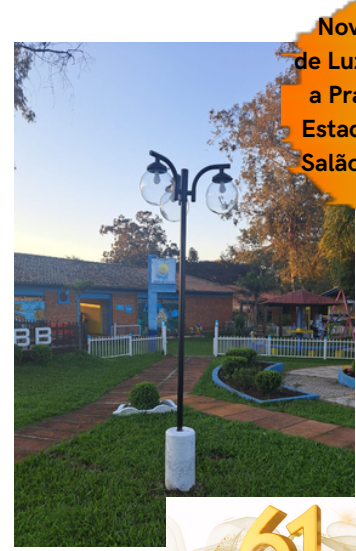
Novos Postes de Luz em Frente a Pracinha e no Estacionamento Salão Mano Veio