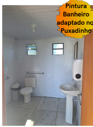
Pintura Banheiro adaptado no Puxadinho