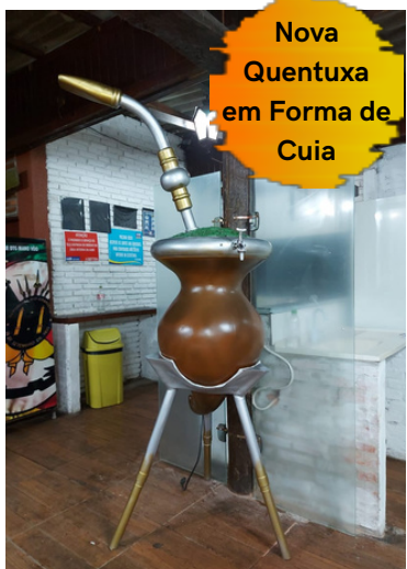
Nova Quentuxa em Forma de Cuia