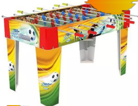
01 Mesa de Pebolim