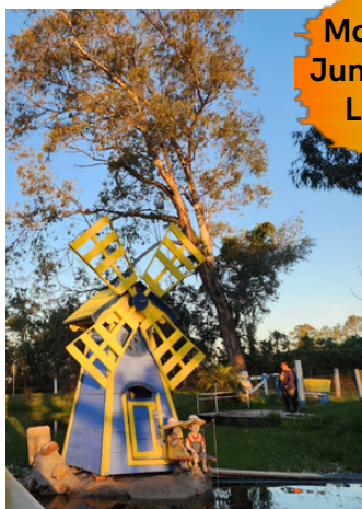
Moinho Junto ao Lago