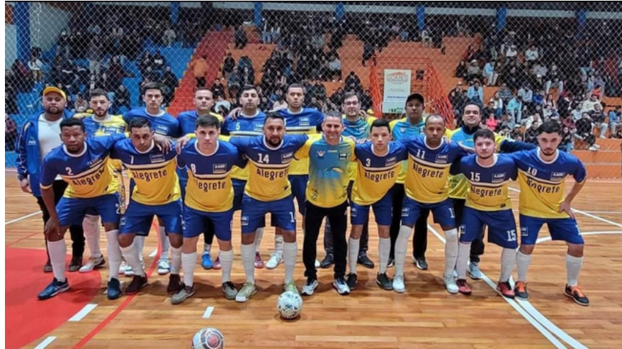
AABB 5x4 Fortaleza Jogo de tirar o fôlego no Ginásio da Arena