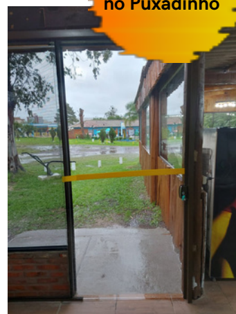
Instalação de Porta de Vidro no Puxadinho