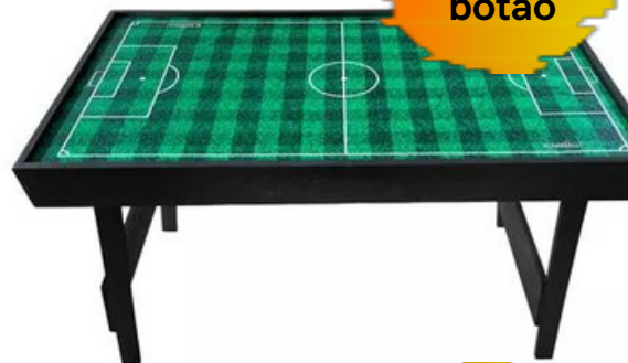
01 mesa de futebol de botão