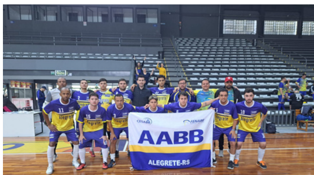
AABB Alegrete Futsal x AABB Caxias do Sul