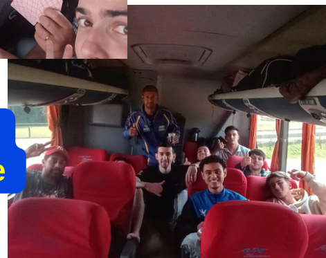
Delegação da AABB Alegrete no ônibus