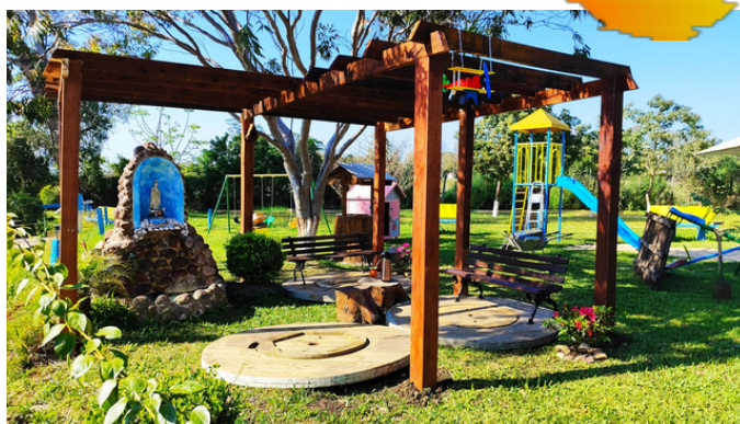
Pergolado próximo ao Lago