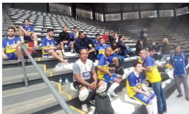
Equipe de Futsal após ganhar de Caxias do Sul por 2 a 0