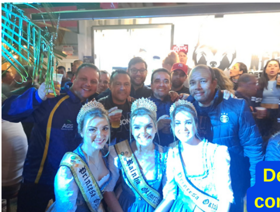
Delegação da AABB Alegrete confraternizando após os jogos