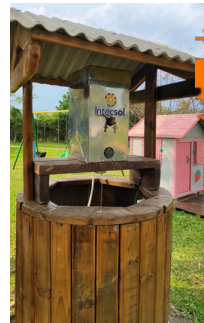
Quentucha próximo ao Lago