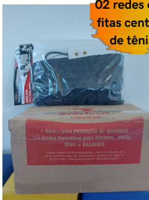
Aquisição de 02 redes e 02 fitas centrais de tênis