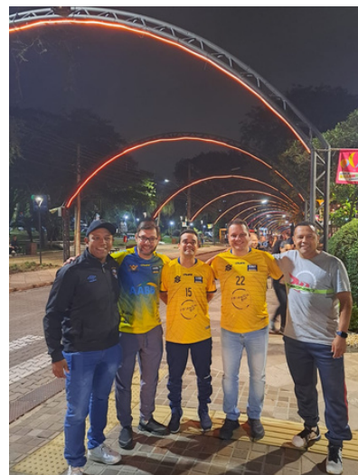
Comissão Técnica e Atletas Futsal