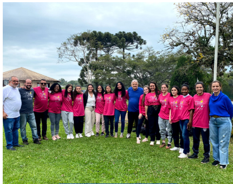
Equipe Organizadora da 48ª Jornada Esportiva Estadual de AABB's (JESAB 2023) - AABB Santa Cruz do Sul