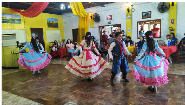
Invernada infantil CTG Farroupilha