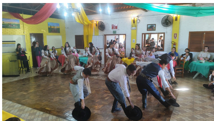
Invernada juvenil Grupo Nativista Ibirapuitã