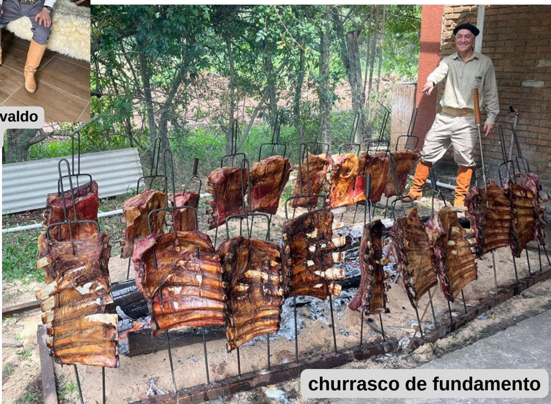
churrasco de fundamento